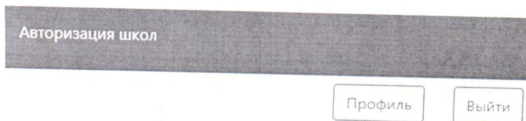
Рисунок 12 – кнопка «Выйти»

Для завершения работы в Программном средстве необходимо нажать кнопку «Выйти», расположенную в правом верхнем углу экрана (рисунок 12).