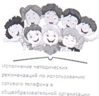
Рисунок 1 – баннер «Исполнение методических рекомендаций по использованию сотового телефона в общеобразовательной организации»

Для авторизации необходимо воспользоваться ссылкой http://test2.ozdorovlenie-nii.ru:8080 или зайти на официальный сайт Роспотребнадзора, Рособрнадзора, Минпросвещения России и через баннер «Исполнение методических рекомендаций по использованию сотовых телефонов в общеобразовательной организации» (рисунок 1) перейти в программу нажатием на пункт «Ссылка для входа и прохождения анкетирования в программном средстве» (рисунок 2).